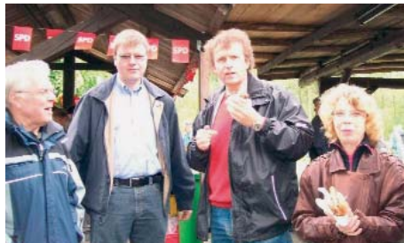
Himmelfahrtsfest der SPD in Einbeck.